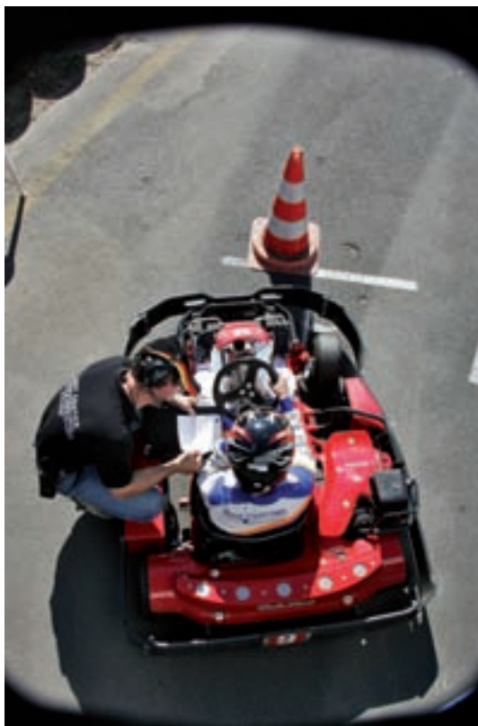
4. Brandenburg-Cup 2010

Leinen los hieß es am 9. September bei der bereits 24. Veranstaltung "Bürgschaftsbank vor Ort", diesmal bei der Firma Teamgeist am Wolziger See. Die 104 Besucher erhielten an diesem Tag spannende Einblicke in die Arbeit der Teamgeist GmbH. Das Unternehmen organisiert erlebnisorientierte Teamtrainings, Events und Incentives, die unter anderem die Motivation von Mitarbeitern nachhaltig beeinflussen sollen. Neben spannenden Vorträgen lud die Teamgeist